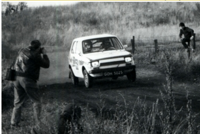
Na trasie Rajdu Kormoran (1987) [3]