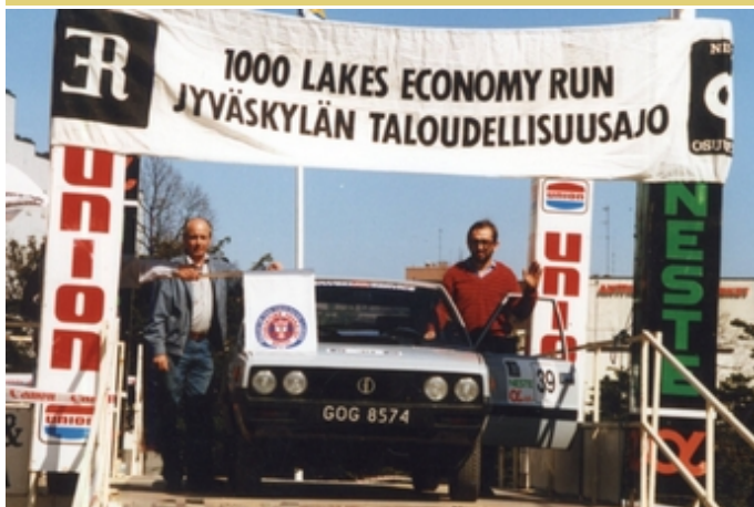
Przed startem do Rajdu 1000 Jezior (Finlandia, 1988) [1]