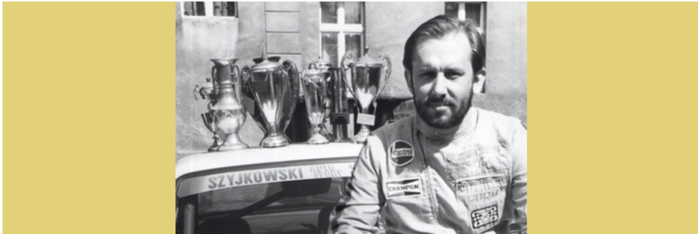
Z pucharami [4]